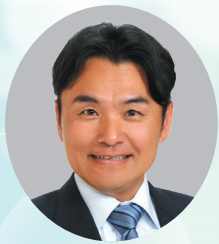
議長 深津 修