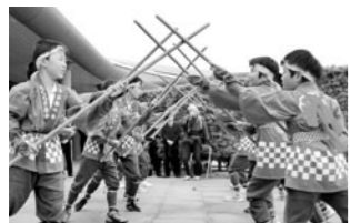
県指定無形民俗文化財「樺の手」(桜井町)