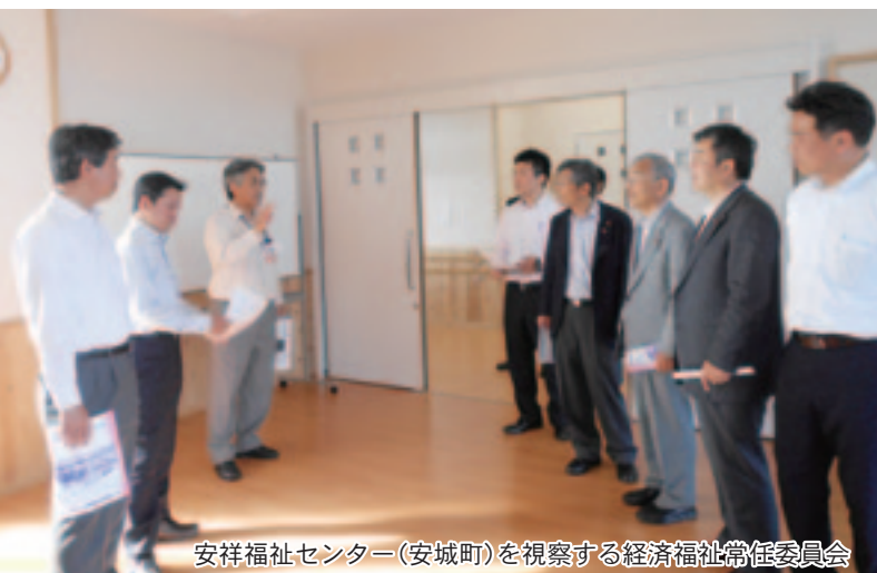
安祥福祉センター(安城町)を視察する経済福祉常任委員会