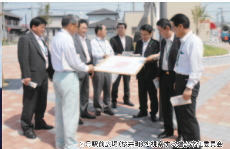
2号駅前広場(桜井町)を視察する建設常任委員会