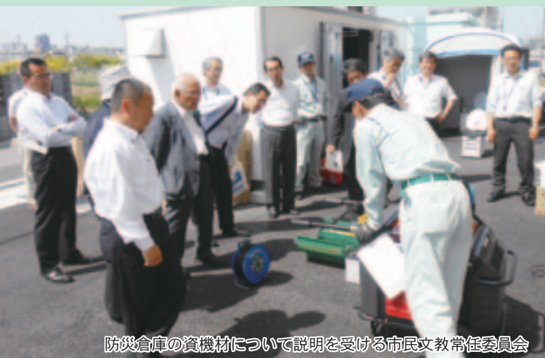
防災倉庫の資機材について説明を受ける市民文教常任委員会