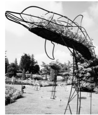
イルカのトビアリー