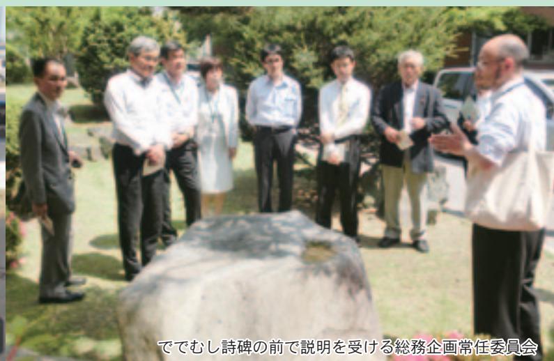
ででむし詩碑の前で説明を受ける総務企画常任委員会