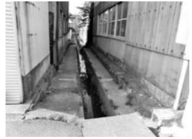
公園西側の排水路

問 荒曽根公園西側排水路へ転落する事故が懸念される。転落防止柵を設置すべきでないか。