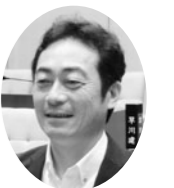
新政みどり 神谷昌宏議員