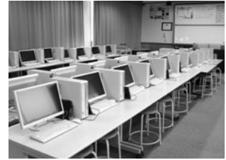
小学校のコンピュータ教室

問 学校で使用するパソコン群をインターネットに接続するものと遮断したものに分けることで、パソコン使用期間を長期化する工夫を検討しているか。 答 国の「教育の情報化」の考え方もインターネットに接続できるものとしており、インターネットを使った調べ学習は中心的なものである。インターネットから遮断したものを分けて設置し、使用目的に応じて使い分けることは現在のこと考えていない。