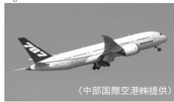
ボーイング787の部品製造には愛知県などの多くの企業が関わっています。

問 国際戦略総合特区であるアジアNo.1航空宇宙産業クラスター形成特区の区域拡大により、安城市も当該区域に加えられることとなったが、今後、どのように臨んでいくのか。