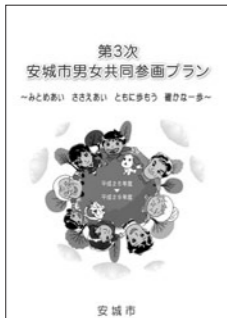
第3次 安城市男女共同参画プラン プランは市公式ウェブサイトでいただけます

問 プランに「DVの根絶」が加えられた。市民に理解と関心を広げるDV相談員養成講座を実施する考えはないか。