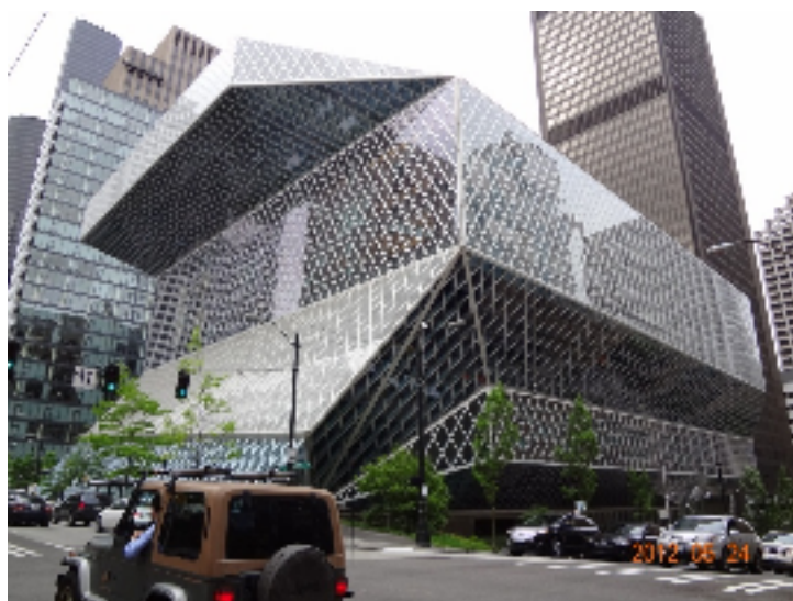
（↑シアトル公共図書館の外観）

建設予算は、総額で 15 億 6 千万ドル（当時の日本円で約 150 億円）という破格の金額だが、中身を聞くと、この金額は、1998 年に公費のシアトル市債（10 年間）として発行が認められた額とのことだった。