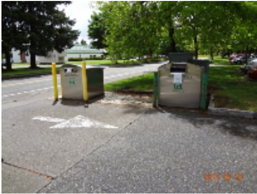
(↑ 郡内の図書館前の返却ポスト)

返却だけなら、図書館前に設置された返却ポストやスーパーでも返却可能とのことだった。